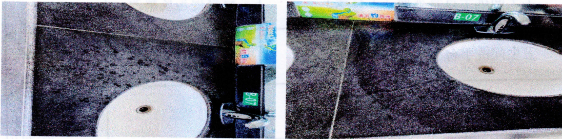
大井停车区（上行线）卫生间洗手台有水渍（16时00分）