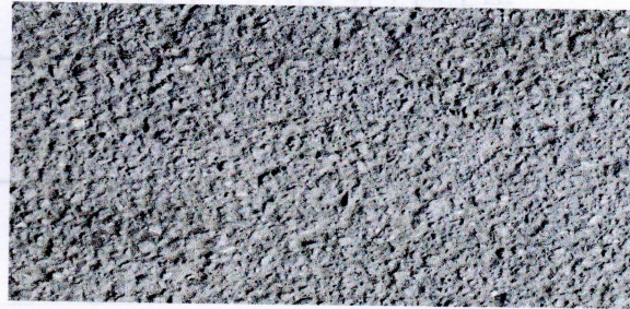
普湖服务区（上行线）停车区地面有垃圾（16时15分）