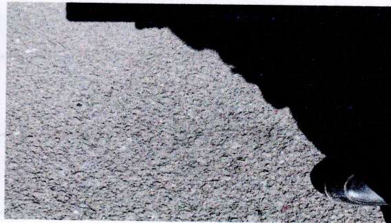
普湖服务区（下行线）停车区地面有垃圾（16时35分）