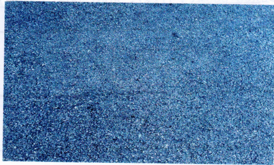
普湖服务区（下行线）停车区地面有垃圾（10时15分）